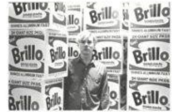
画像左：森村泰昌「モリロとモリリン（仮称）」展示風景 第9回恵比寿映像祭 2017年 東京都写真美術館 © 森村泰昌 画像右：フレッド・マクダラー〈アンディ・ウォーホル〉1964年 『ウォーホル図録』リプロダクト 1990年より転載

鳥取県立美術館の開館に向けて新たに収蔵したアンディ・ウォーホルの《ブリロ・ボックス》は美術の歴史の中でどのような重要性を秘めているのか。専門家の立場から解説いたします。