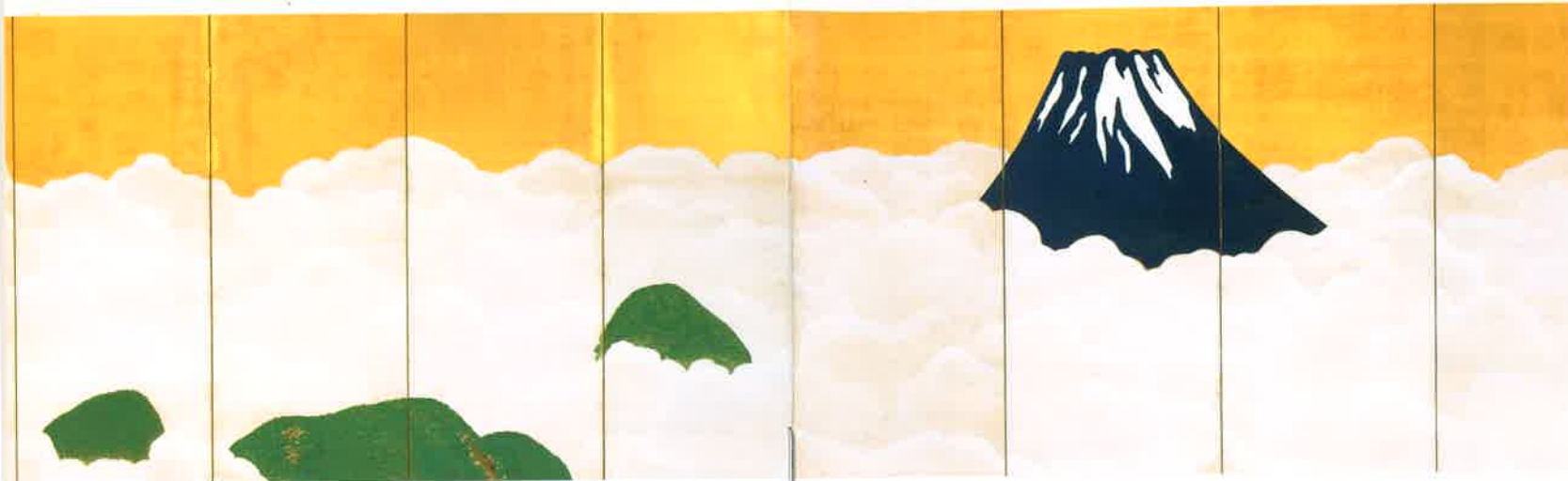
横山大観《群青富士》(部分) 静岡県立美術館蔵