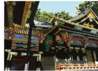
国宝 久能山東照宮

徳川家康公を祀る神社。最高の技術・芸術が施された「権現造」の社殿は、平成22年国宝に指定された。4月17日は家康公の命日。